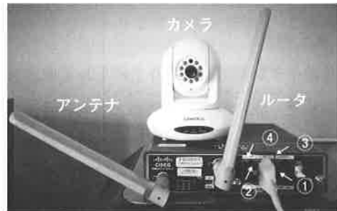
図 2 カメラと SIM データ

図 3 は自宅に設置した PC 心電計に施設の PC からリモートアクセスして導いた心電図の 1 例である。患者の状態を把握してから在宅に向かうことができる。