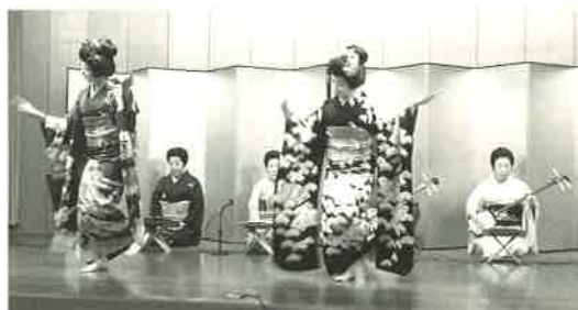
祝舞は盛岡芸妓の皆さん