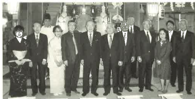
櫻山神社での神事